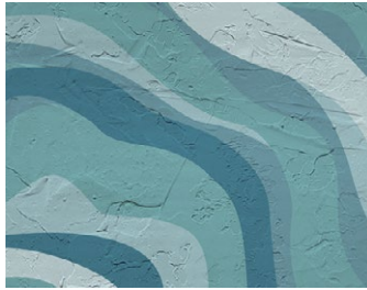
Rivestimento superficiale in malta con stampa artistica / Artistic printed mortar surface coating