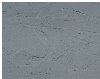
Rivestimento superficiale in malta laccata opaca / Matt lacquered mortar surface coating